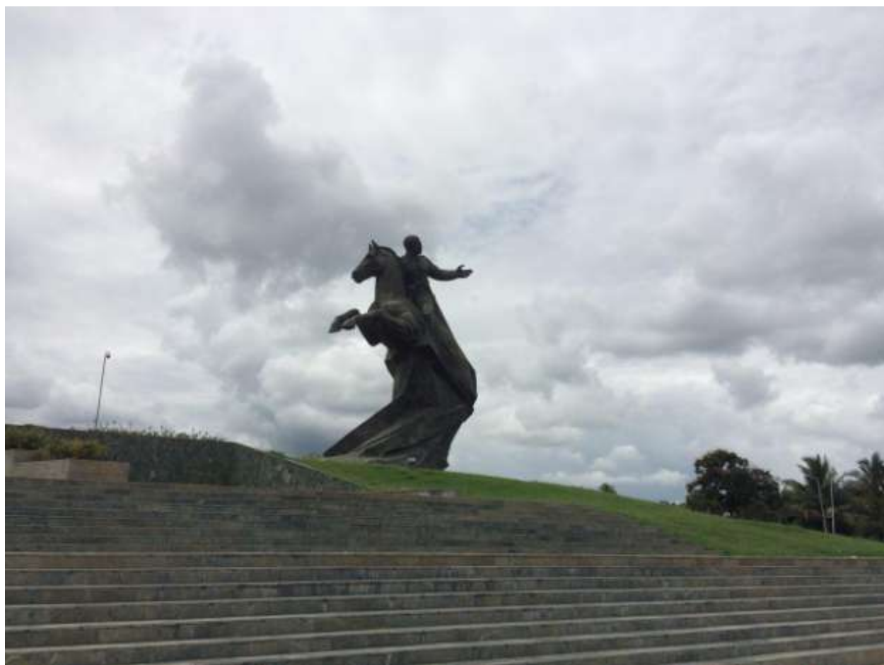
میدان انقلاب سانتیاگو: مجسمه‌ی آنتونیو ماسئو