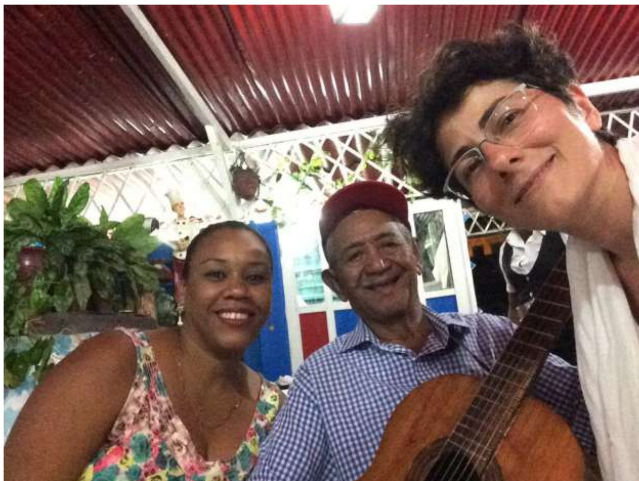
عكس یادگاری با دو نوازنده