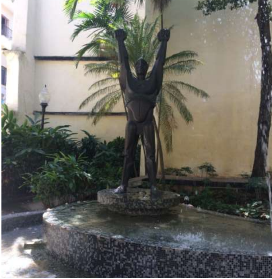
هاوانا: هنر شهري