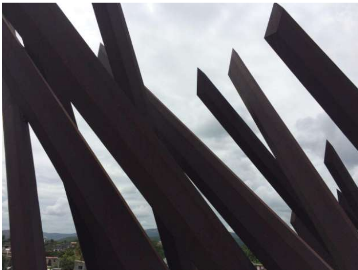
میدان انقلاب سانتیاگو، ماچه ته (داس نیشکر)