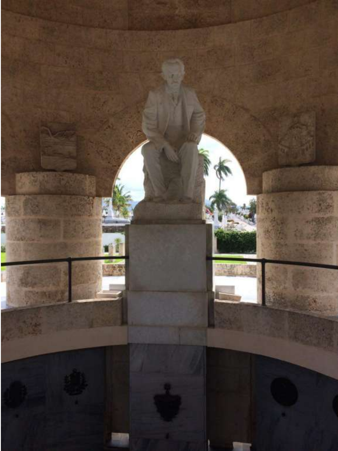
بنای یادبود و مجسمه‌ی خوزه مارتی؛ نویسنده و رهبر فکری کوبا در مبارزات ضد استعماری