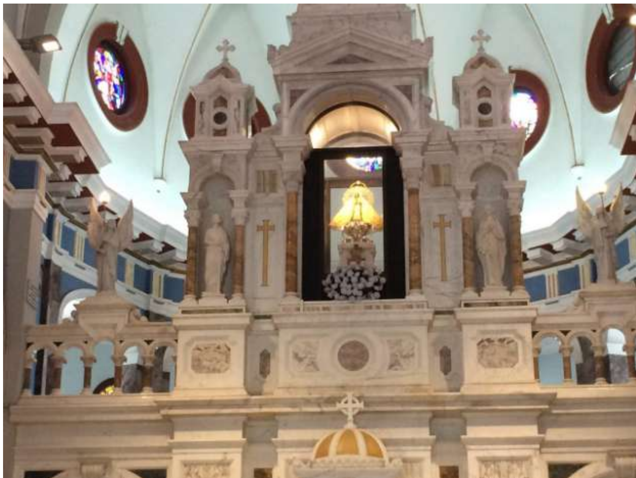
کلیسای سانتاماریا در اطراف سانتیاگو: نمادی از عدم تضاد میان سوسیالیسم کوبایی و مذهب