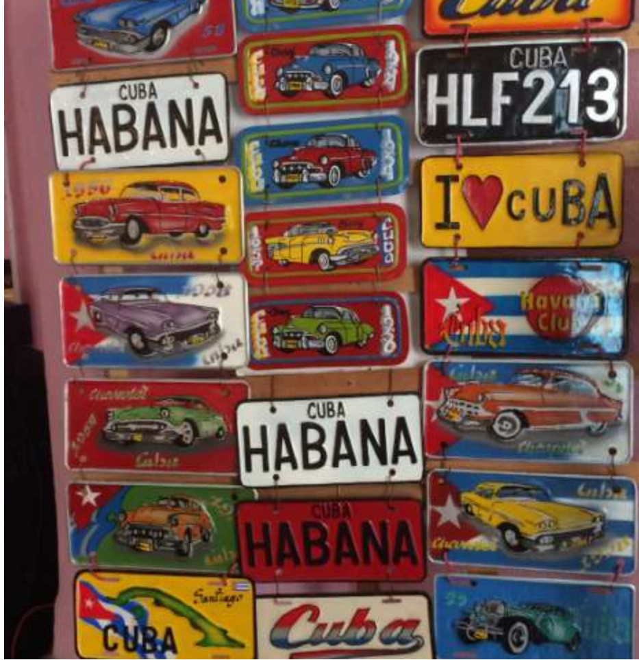
پلاک اتوموبیل : سوغات کوبا