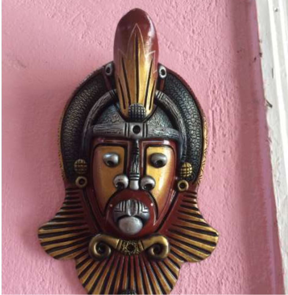
سانتیاگو: ماسک‌های کارناوال