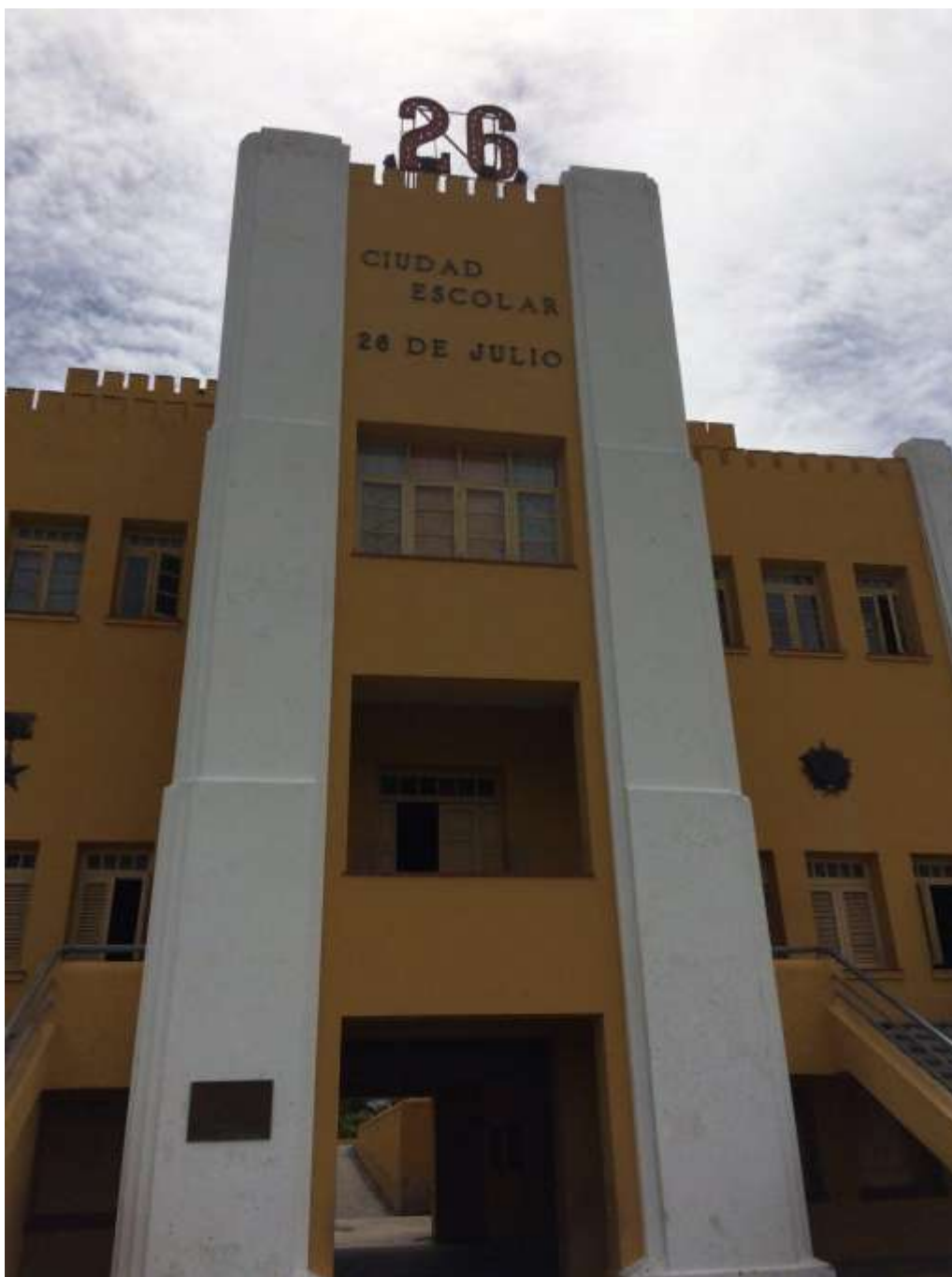
مدرسه ی ۲۶ ژوئیه که پیشتر پادگان بود