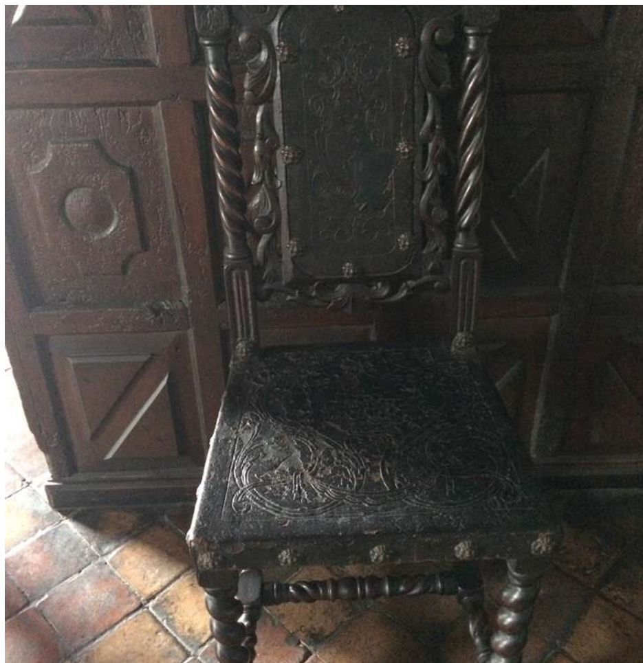
خانه‌ی وسلاسکز: قدیمی‌ترین خانه‌ی سانتیاگو