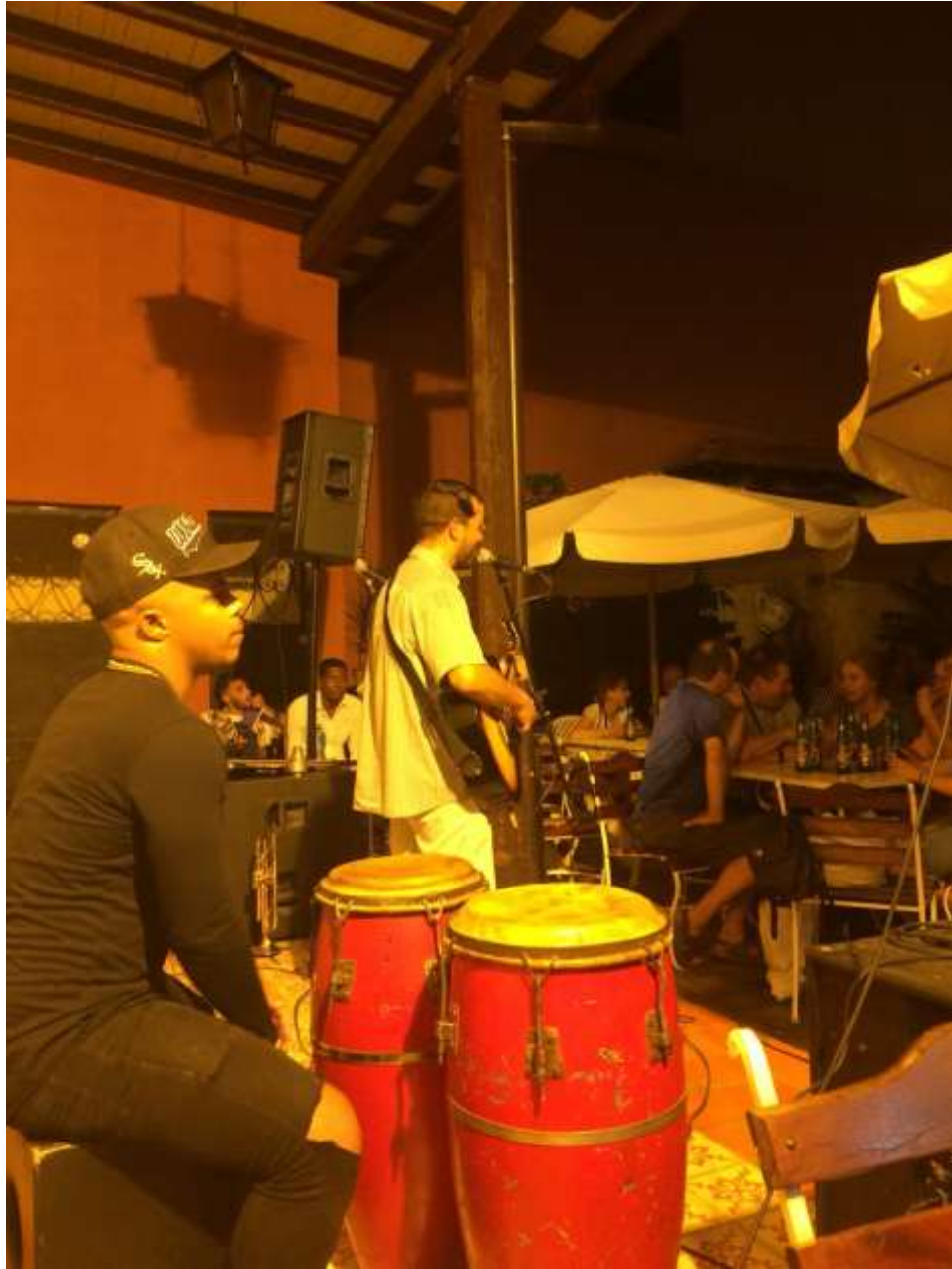
ساتیآگو: کنسرت جاز