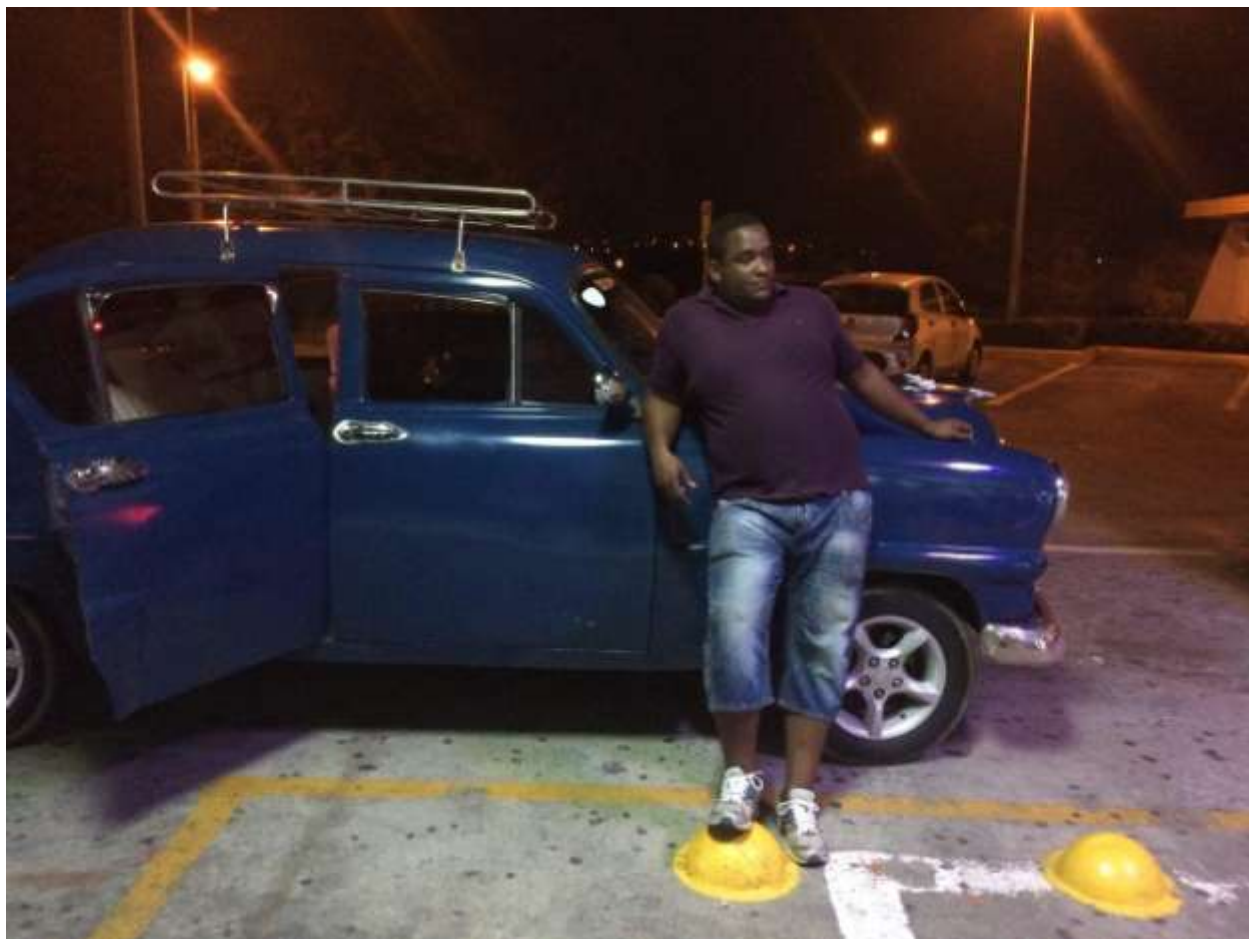
یک تاکسی قدیمی و راننده