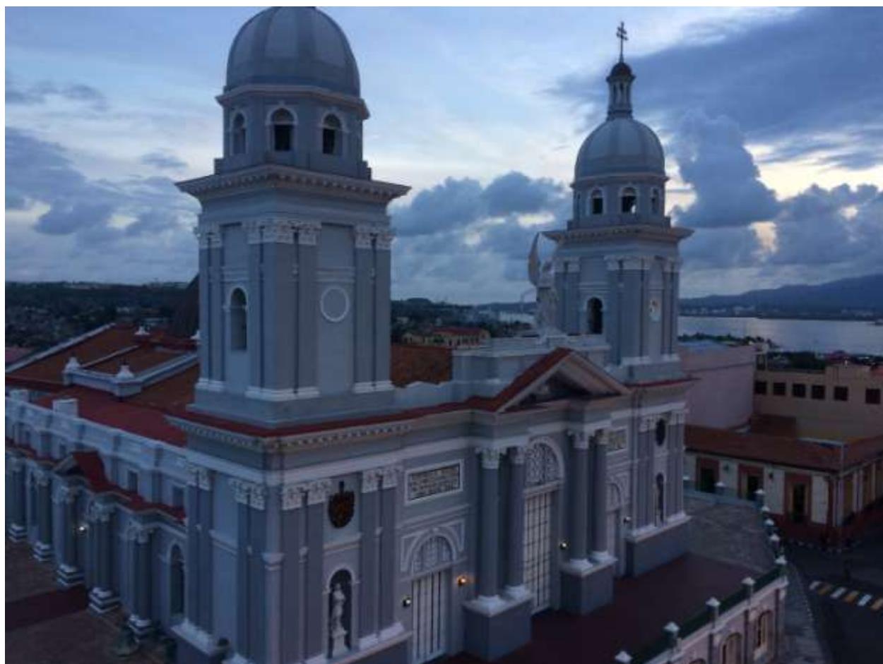
سانتیاگو: کلیسای سان باسیلیکو