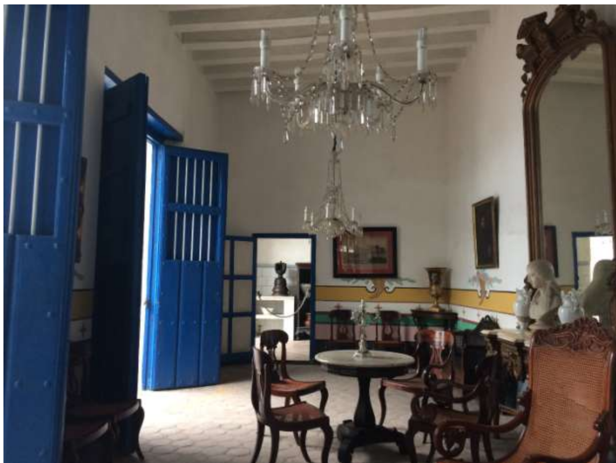
خانه ی ولاسکز