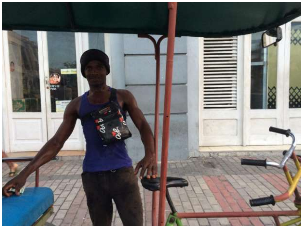
راننده‌ی ریکشای دوچرخه‌ای