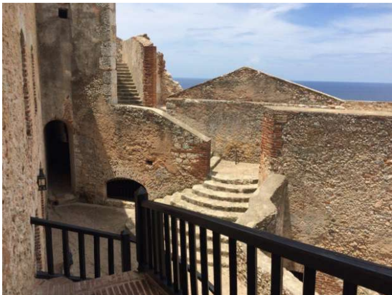
دژ اسپانیایی بر کناره‌ی کارائیب