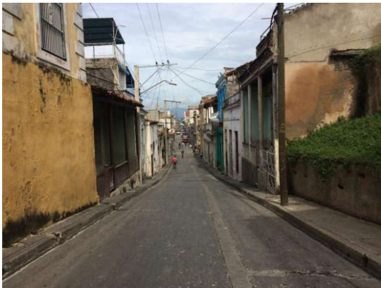
خیابان سن باسیلیکو در سانتیاگو