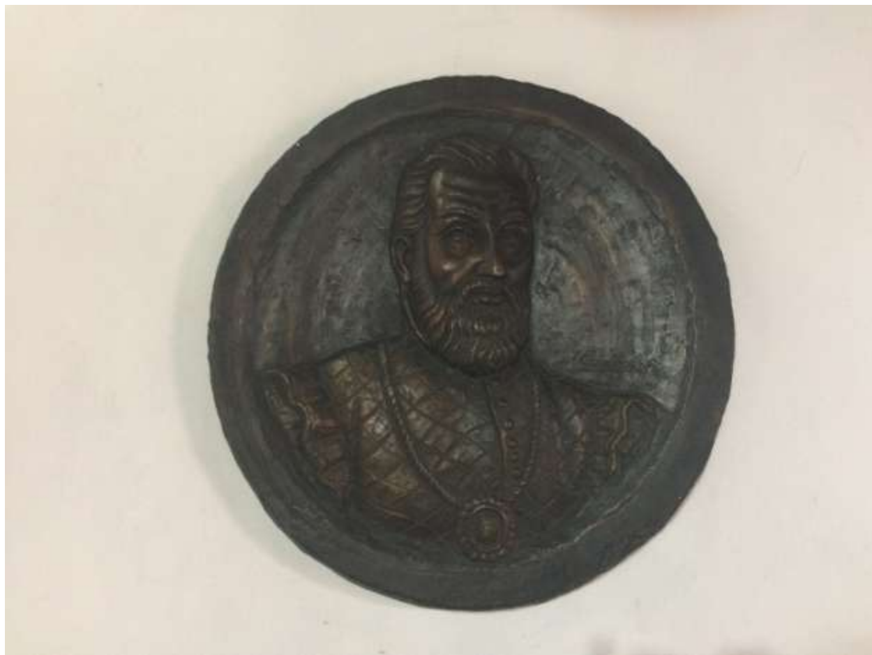
تصویری از ولاسکز: صاحبخانه و از نخستین استعمارگران اسپانیایی