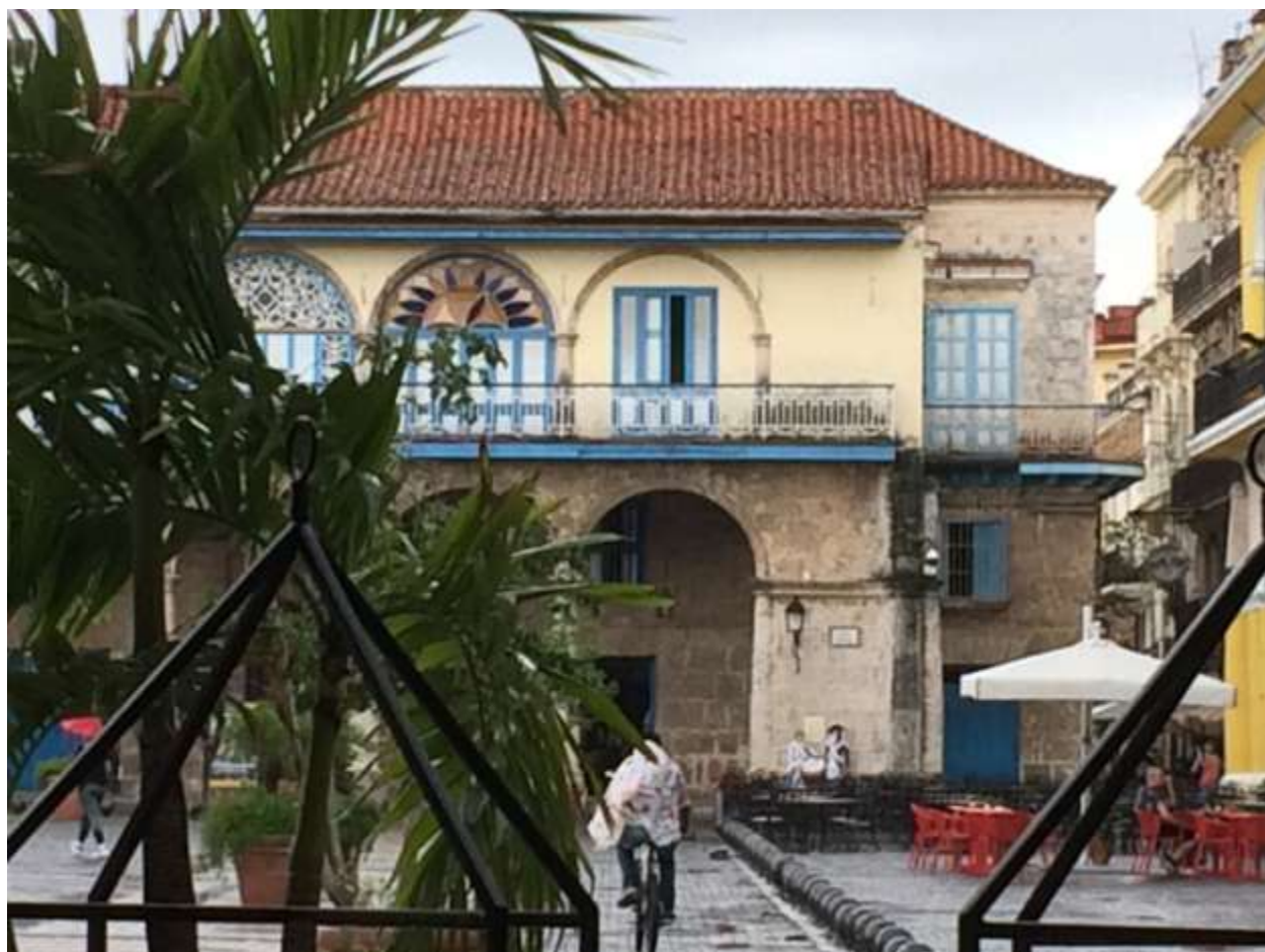
هاوانا: نمایی دیگر از پلازا وِیا