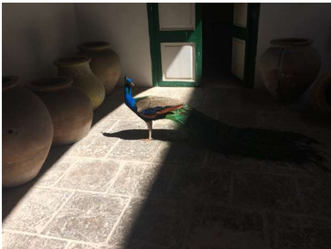
هاوانا: درون خانه‌ی موسوم به «عربی»