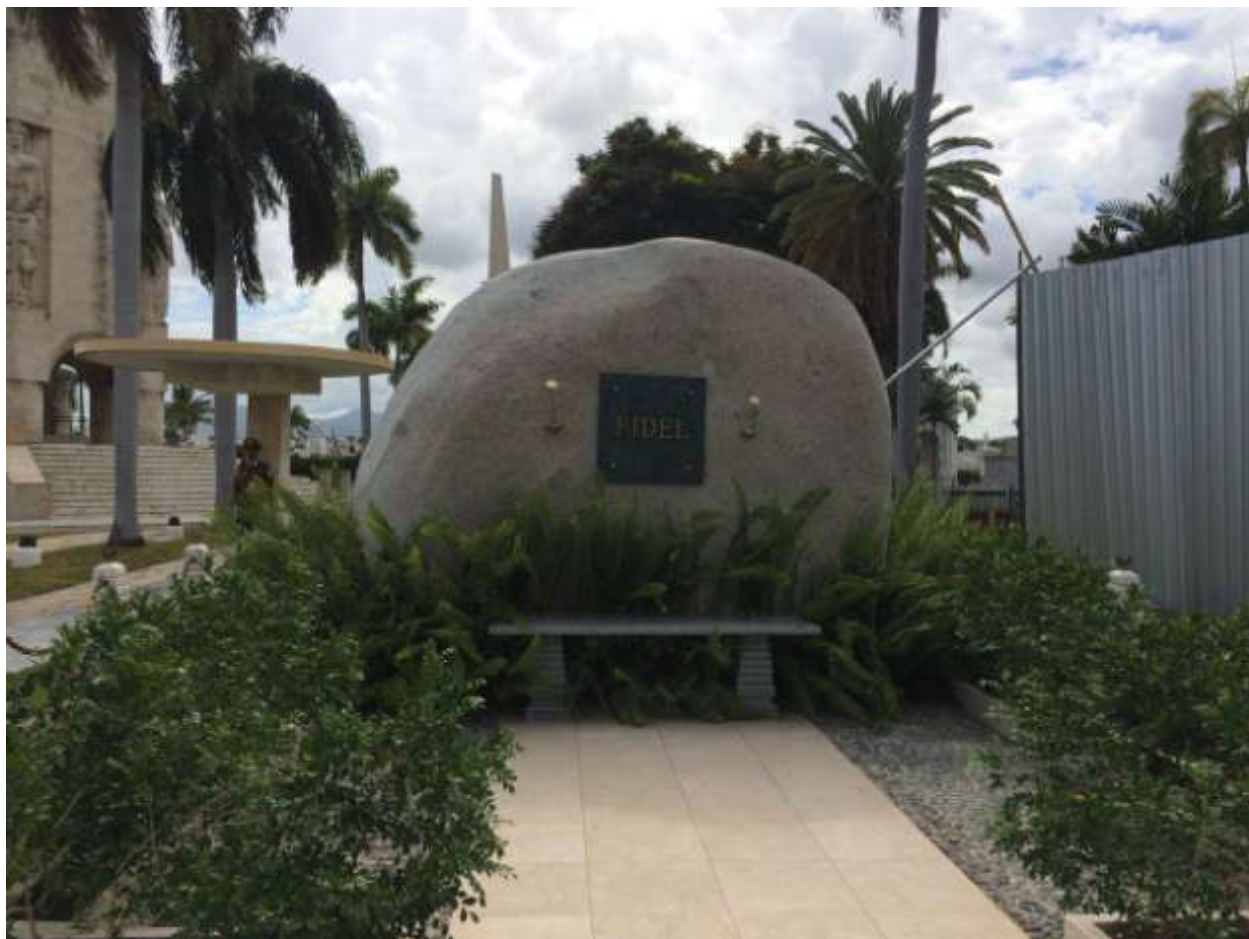
آرامگاه ساده و عاری از تجملِ فیدل در کنار بنای یادبود خوزه مارتی که در سمت چپ واقع شده