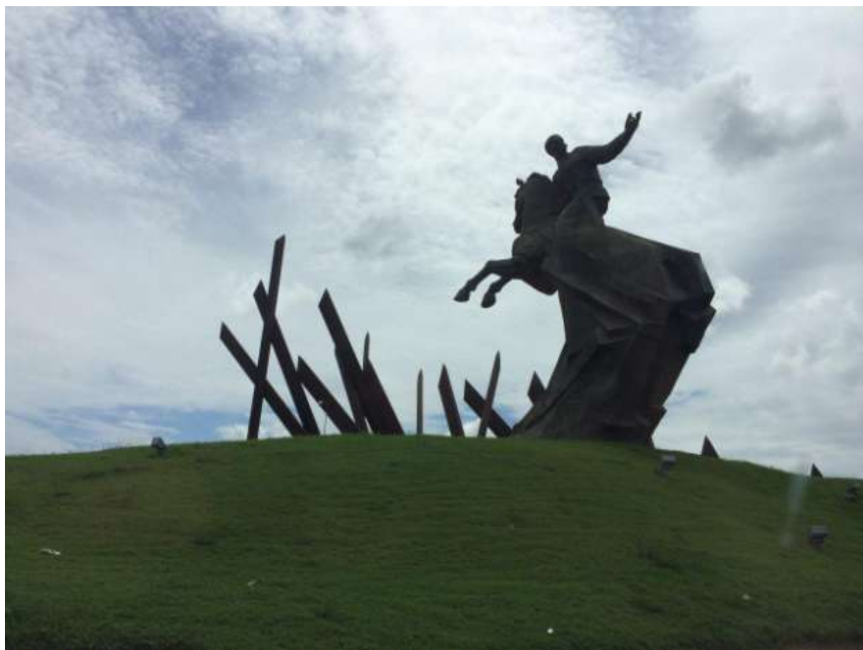
میدان انقلاب سانتیاگو