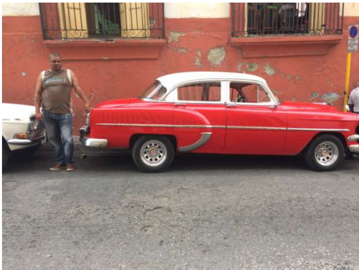
یک تاکسی قدیمی و راننده