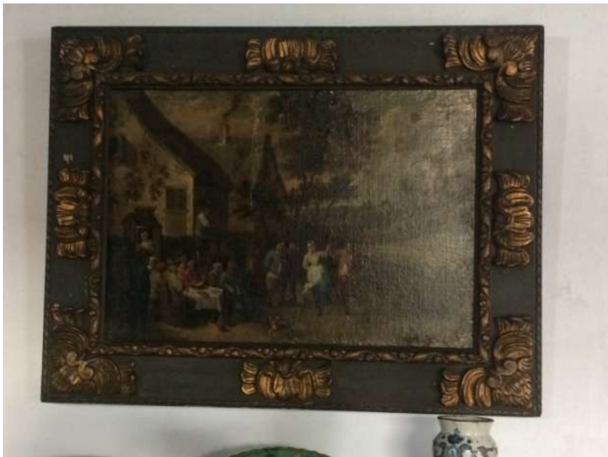
خانه‌ی ولاسکز: نقاشی رنگ و روغن متعلق به سده‌ی ۱۵ میلادی