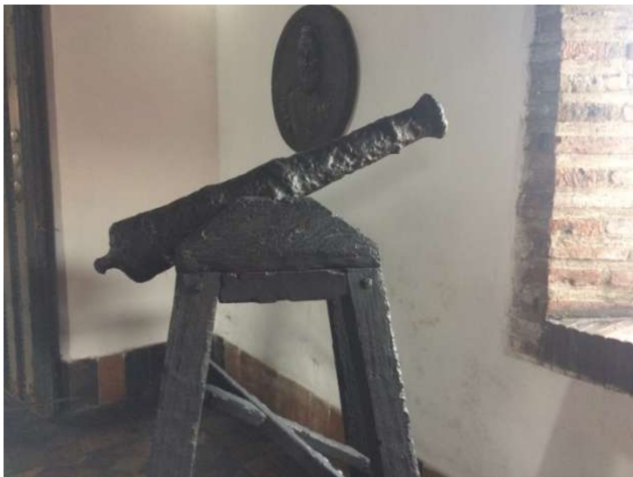
خانه ی ولاسکز: توپ قدیمی