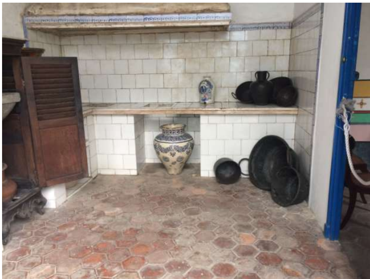
خانه ی ولاسکز