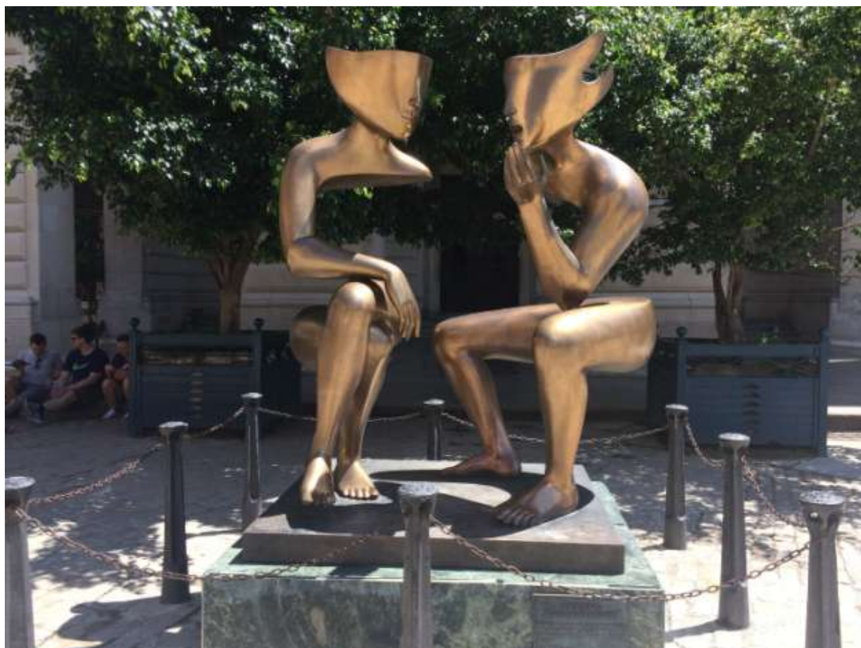
هاوانا: هنر شهری