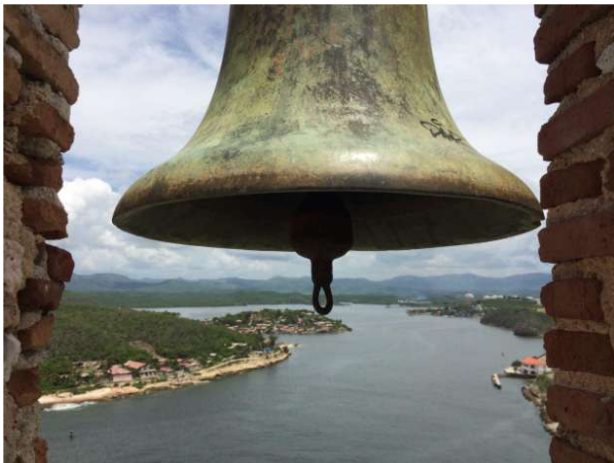
دژ اسپانیایی با چشم اندازی به کارائیب