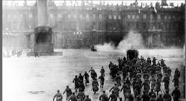
انقلاب اکتبر - ۱۹۱۷