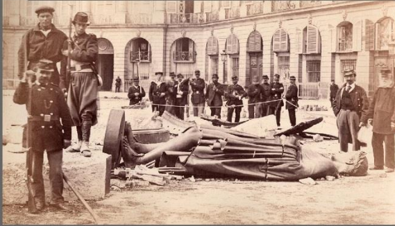
کمون پاریس - ۱۸۷۱