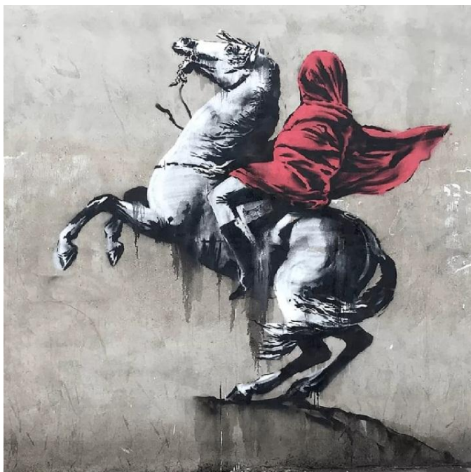
طرح از بنکسی